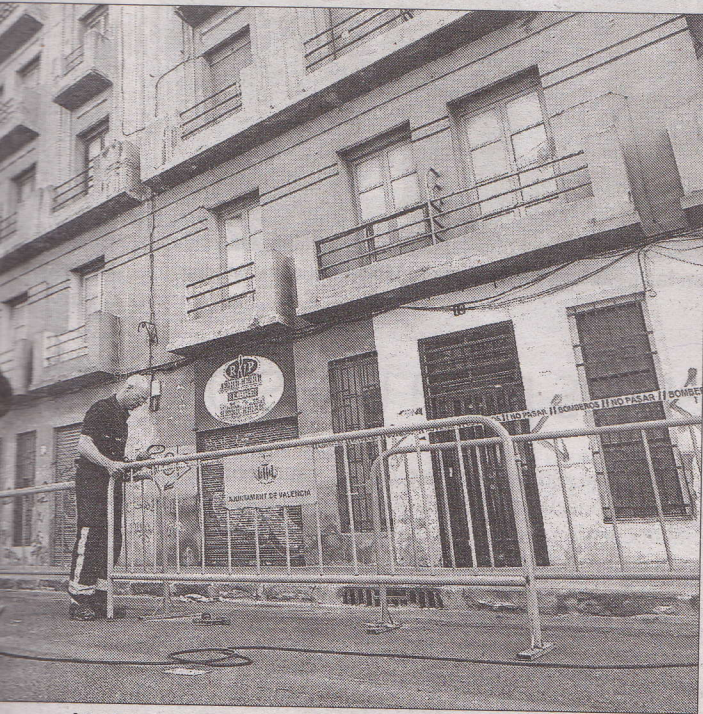
Seguridad en la calle Martínez Aloy. MANUEL MOLINES